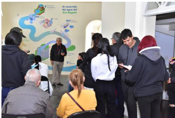
Fotografía 6 Actividad de sensibilización en torno al río Bogotá

Estas jornadas incluyen: la visita a exposiciones museológicas de Casa museo Tequendama, y tertulia literaria sobre la importancia del Salto de Tequendama en la literatura colombiana, personal necesario para la realización de la actividad.