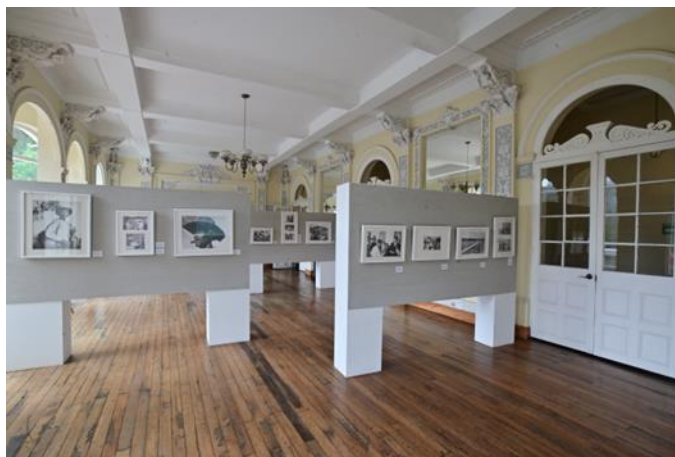
Fotografía 3 Montaje de la exposición Campo revelado

Gracias al apoyo del Museo Nacional a través de su programa de itinerancia, se logró obtener la estancia de la exposición fotográfica de los años 70, denominada Campo revelado , y que trata sobre los conflictos de tierra y la reforma agraria de la época. Fue una exposición muy bien recibida tanto por el público visitante como por los monitores pedagógicos del Museo, ya que la región fue zona de reforma agraria en su momento.