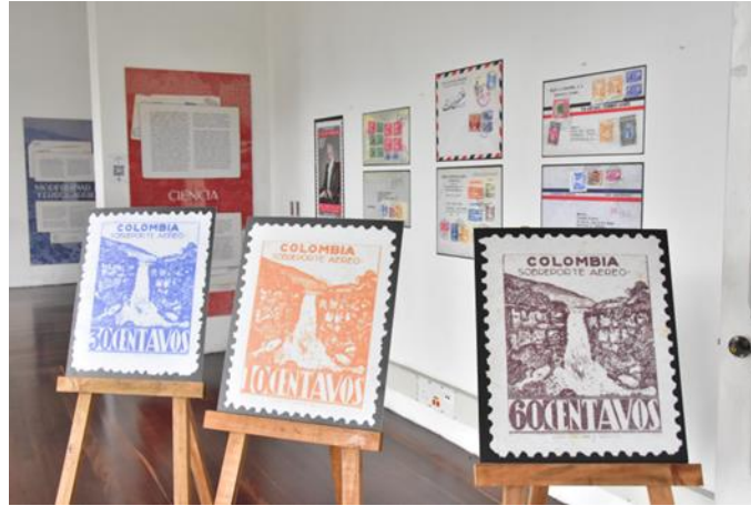
Fotografía 4 Montaje Imágenes migrantes

Es una exposición financiada por la Fundación GEP y que ahora mismo se encuentra en exhibición.