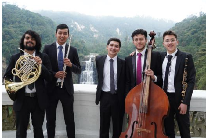
Fotografía 7 Jornada musical del 17 de septiembre.