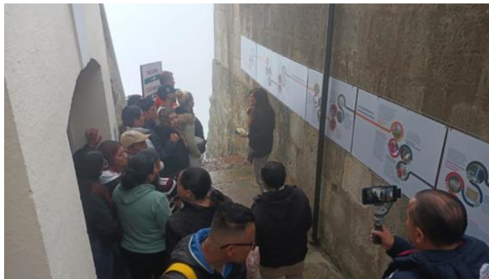
Fotografía 5 Inauguración exposición Saltos en el Tiempo

Gracias a la convocatoria Suarte 2023 de la alcaldía de Soacha, la Fundación logró desarrollar una exposición que narra la cronología del Salto de Tequendama desde el siglo XVII y la incorporación de la Casa Museo a partir de comienzos del siglo XX. Es una exposición de carácter itinerante y para la cual se están ubicando espacios para su exhibición.