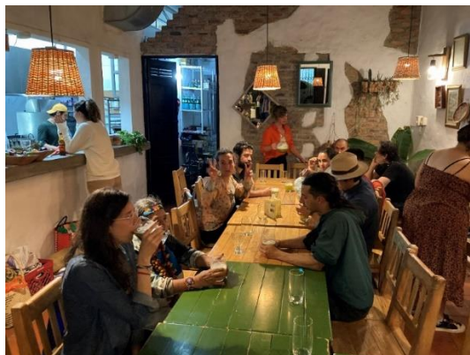
Fotografía 11 Encuentro previo a actividad de piquete