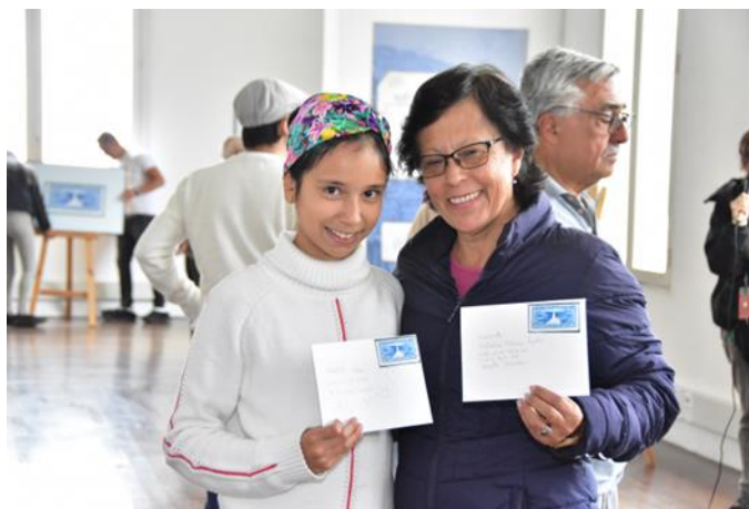
Fotografía 9 Imagen de asistentes a la inauguración a la exposición de Imágenes Migrantes