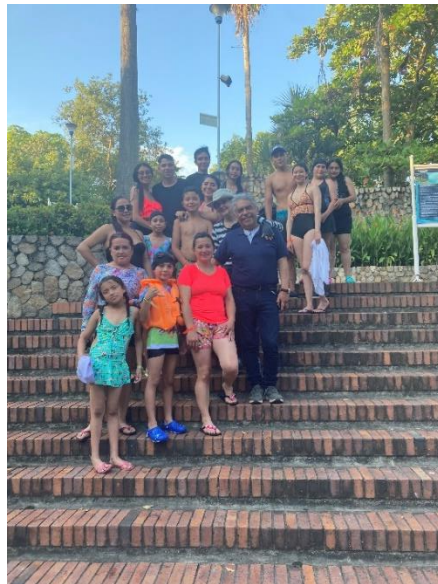
Fotografía 1Imagen del grupo durante el paseo a Piscilago.

En el contexto del objeto de abrir espacios de convivencia para que la familia como base de la pirámide social, consolide sus vínculos afectivos se realizó la salida con los colaboradores de la Fundación GEP y sus familias a PISCILAGO el día 25 de enero de 2023. Además, se organizó un almuerzo de integración de fin de año en el restaurante Creps & waffles del centro comercial Ventura en Soacha.