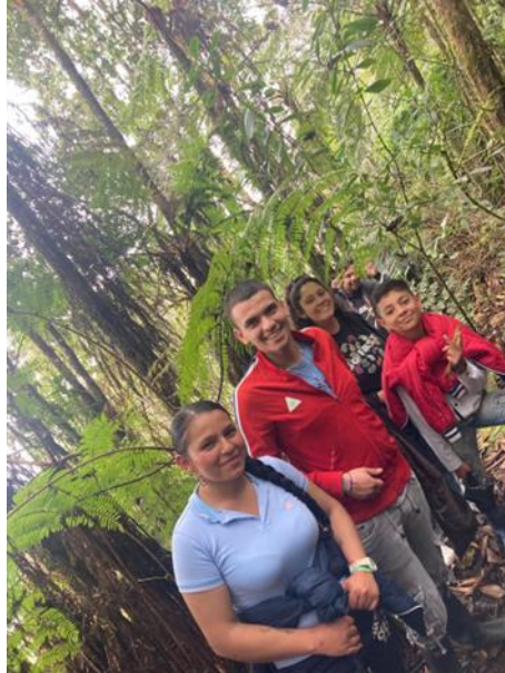
Fotografía 10 Salida de campo a la reserva el Porvenir

recorrido en los bosques anexos al Salto de Tequendama. Estas actividades se cumplieron en jornadas realizadas los días 7 y 28 de octubre con un total de participación de 68 personas.